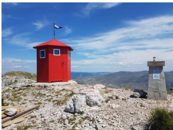
vrh Dinare - Sinjal

Po dolasku u kraljevski grad, obilazak KNINSKE TVRĐAVE, jedne od najvećih fortifikacijskih građevina u Dalmaciji. Izvorna utvrda je iz X. stoljeća, a kasnije je proširena do 480 m dužine i 110 m širine. Tvrđava je bila povremeno sjedište hrvatskih kraljeva i stalno sjedište kralja Dmitra Zvonimira. Pokretni mostovi dijele tri glavna dijela Tvrđave: gornji, srednji i donji grad. Sa sjeverne strane je veliki prokop koji dijeli Tvrđavu od brda Spas. Bunari, mračni hodnici, tajni prolazi, gorostasne zidine i crkva svete Barbare lako prenose posjetitelje u svijet srednjovjekovlja.