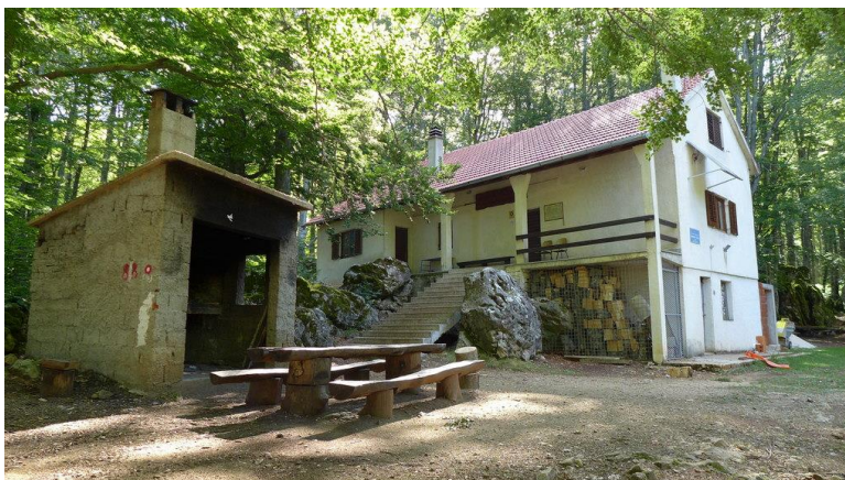
planinarska kuća na Brezovcu